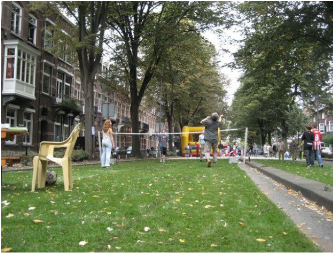
impressie autovrije zondag Hertogsingel 2007

Na 2008 is gezocht naar een meer structurele invulling van de autovrije zondag. Deze is gevonden door een koppeling te maken met het Parcours, onder de noemer 'Parcours autovrij' (vanaf 2009). In 2009 is zelfs de landelijke autoloze zondag (in het kader van de week van de vooruitgang) geopend in de theatrale fietsenstalling op het Vrijthof.